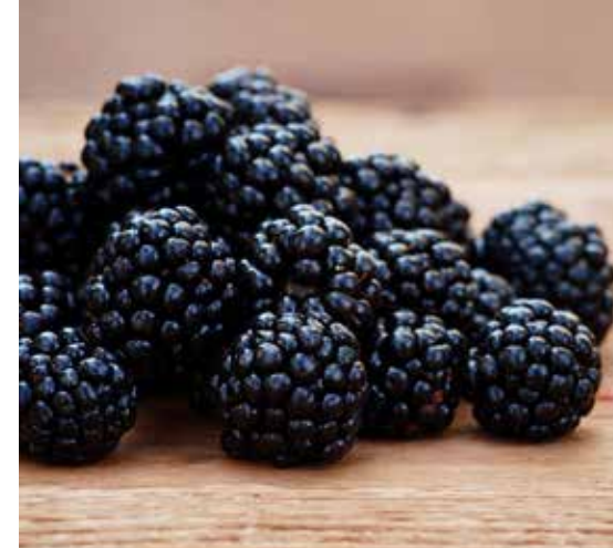
Mejorar calidad y productividad.