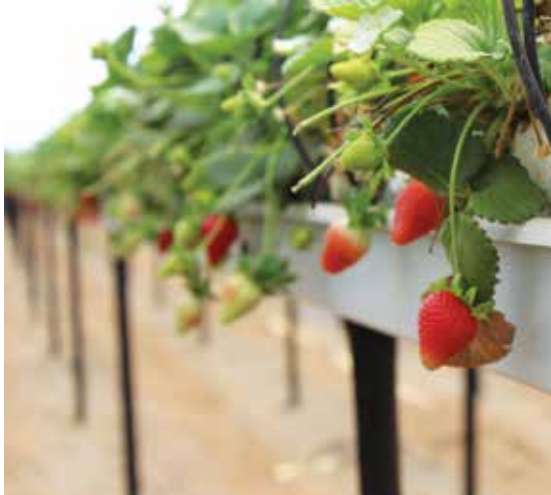
Cultivo sustentable, producción libre de plaguicidas y orgánica.