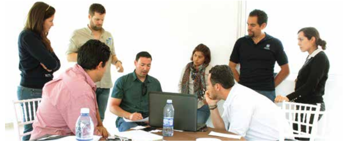
Consultoría y asesoría a productores de Driscoll's