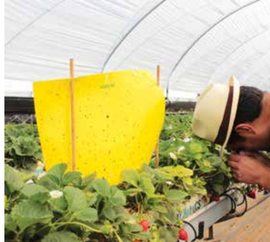
Manejo agronómico y cultivos hidropónicos.