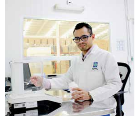
Investigación y desarrollo.